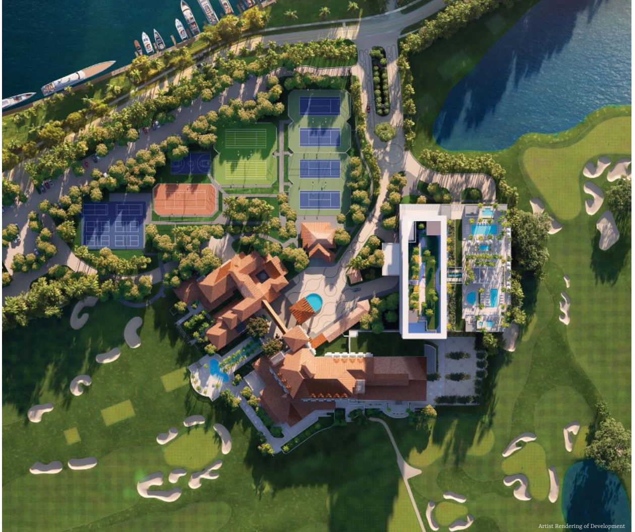
Artist Rendering of Development